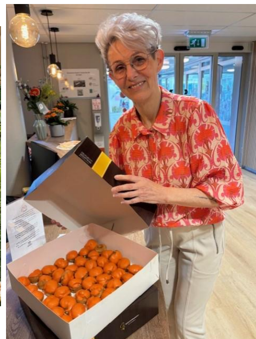
Oranje soesjes, geschonken door het Oranje Comité