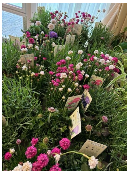
Plantjes van de Plus zegels, om de tuinen op te fleuren