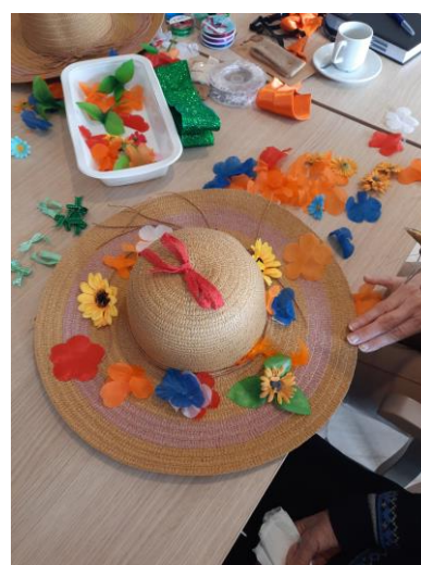
Creamiddag, voorbereiding voor Koningsdag