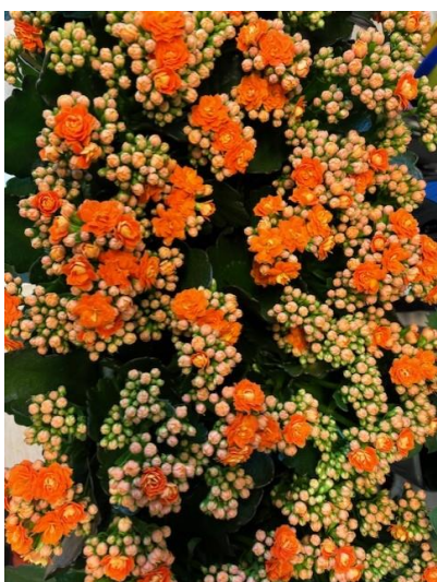
Deze plantjes zijn geschonken voor de recreatiezaal