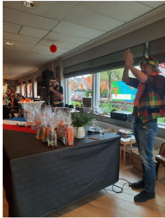
Muziekbingo met een bezoek van Willem Alexander en Maxima