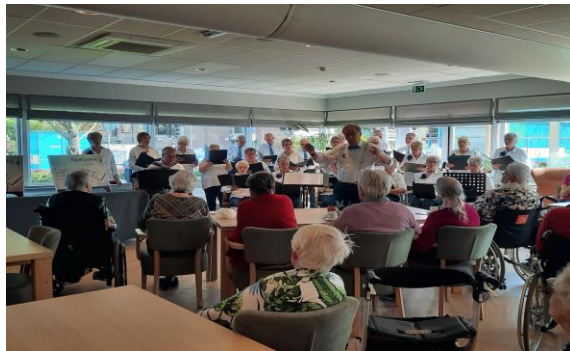
Optreden koor Faria