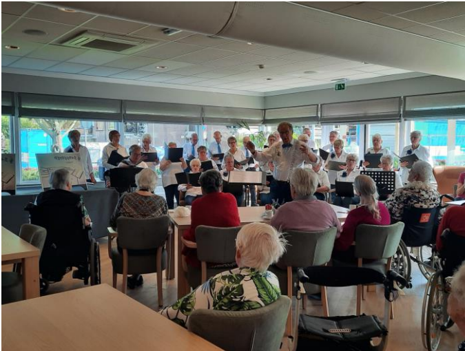
Optreden koor Faria