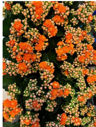
Plantjes geschonken voor de zaal