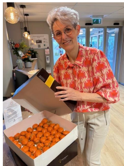
Oranje soesjes Aangeboden door het Oranje Comitè