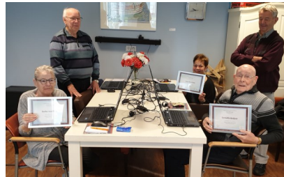
Na afloop van de cursus ontvangt u een certificaat

U kunt u aanmelden door een mail te sturen naar het.veerhuis@careyn.nl . Na betaling van het cursusgeld is uw deelname definitief.