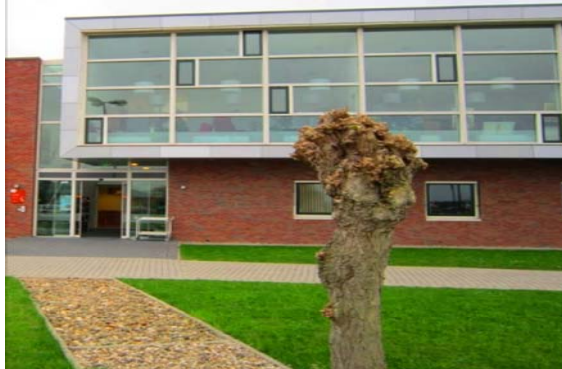
Careyn Activiteiten Centrum 't Akcent Waar het draait om u!