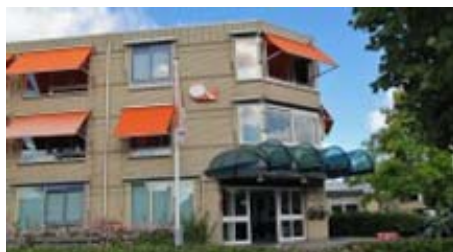
Careyn Activiteiten Centrum 't Tuinhuis Waar u het middelpunt bent!