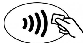
Contactloos betalen-logo op betaalautomaat

Als u nog geen contactloze betaalpas heeft kunt u contact met uw eigen bank opnemen om te informeren of zij contactloos betalen aanbieden.